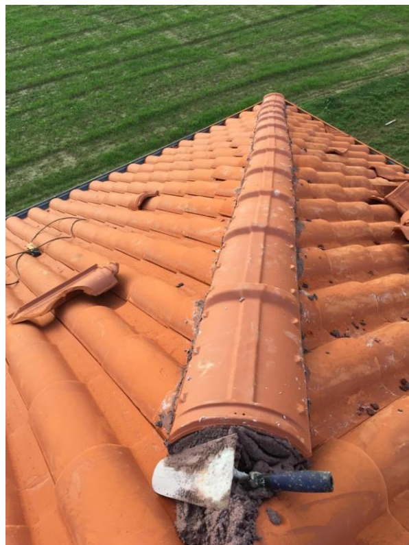
Il tetto finanziato dal Ticino.

hanno contribuito alla buona riuscita di questo progetto!