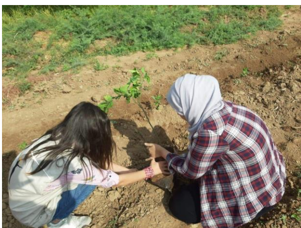
Pensando al futuro sul posto!

In novembre ci siamo recati di nuovo sul posto per incontrare le nostre persone di contatto e per fare il punto della situazione.