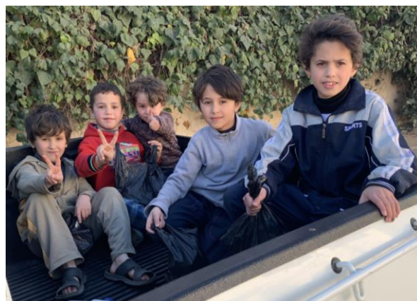
Bambini felici in Giordania.

Asilo infantile in Giordania: Azione bambini felici!